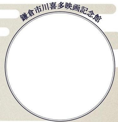
鎌倉市川喜多映画記念館