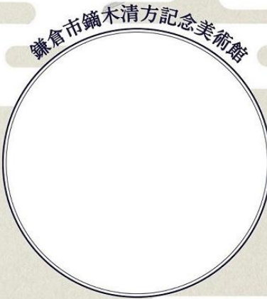
鎌倉市鍋木清方記念美術館