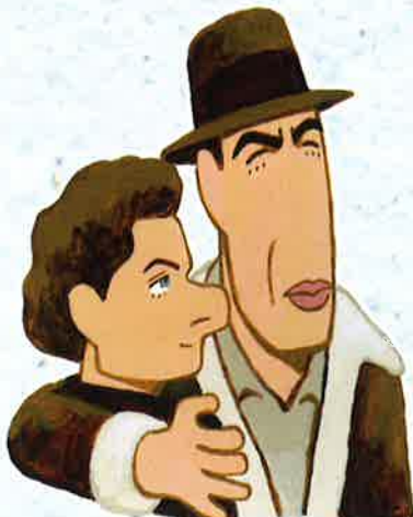
「誰が為に鐘は鳴る」

本企画展では、ハリウッド・カップルにスポットを当て、劇映画の中での理想の組み合わせからスクリーンを離れても寄り添ったふたりまで、その恋愛模様を出演映画のポスターやスチル写真で辿ります。きっとあなたの胸をときめかせた理想のカップルが、そこには登場することでしょう。