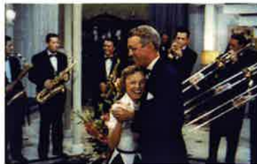
©1960 by Universal Pictures Co., Inc. Country of Origin U.S.A.

1954年/カラー/DCP/117分 監督:アンソニー・マン 出演:ジェームズ・スチュアート、 ジューン・アリスン、ルイ・アームストロング、 ベン・ボラック